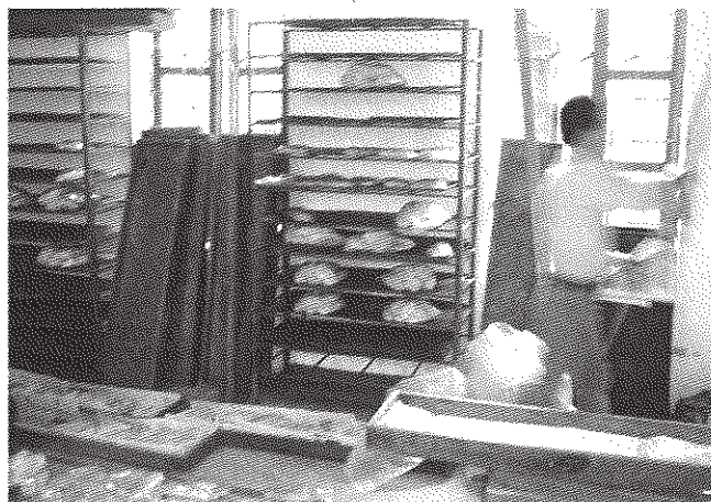
Formation aux métiers de la boulangerie.