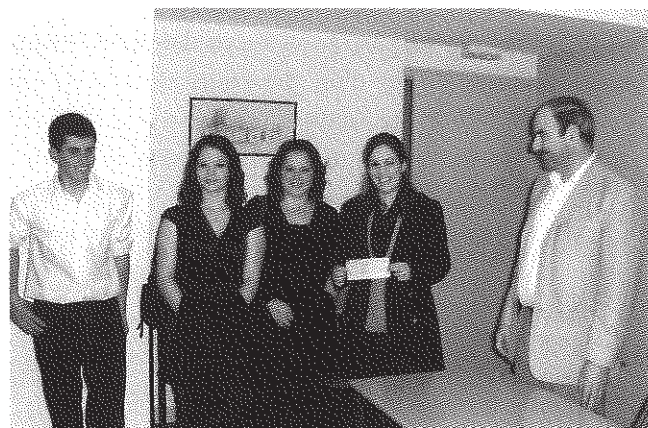
Remise du chèque du Lions Club de Villefranche-de-Rouergue aux étudiants de l'institut François-Marty.

Nous avons fourni aux 2 régions des vélos pour un montant de 3 800 euros, et à Bac Giang nous avons financé le creusement de 3 puits , 3 000 euros.