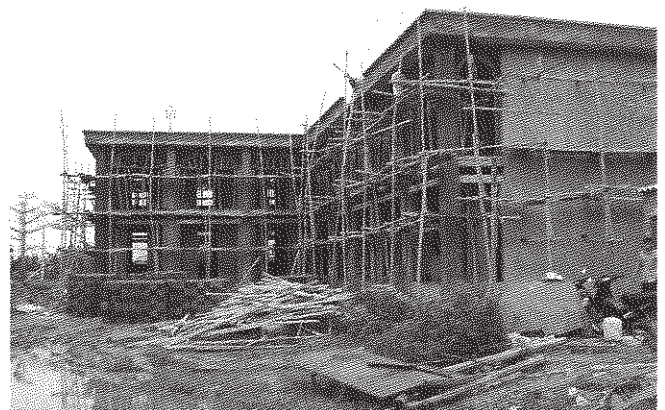
Le Centre d'Accueil de malvoyants en construction à Nam Dinh.

Ce projet financé en grande partie par Un Autre Regard avec le financement d'un généreux donateur, sera complété en 2010 par l'aménagement d'une cour et la construction d'une salle de sport financés par Vitam.