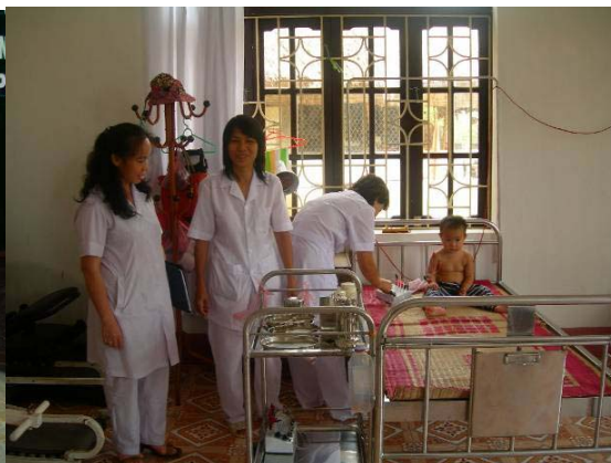
Soins au centre OPH