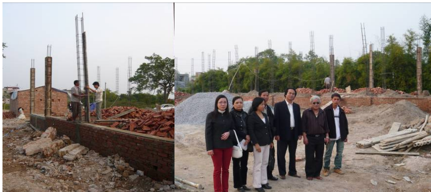
Site du chantier du centre d'éducation et d'apprentissage de Nam Dinh